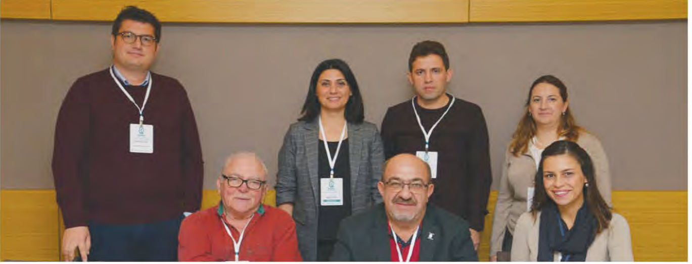
Çağlar Çubuk / Kurumsal Harç Endeksi