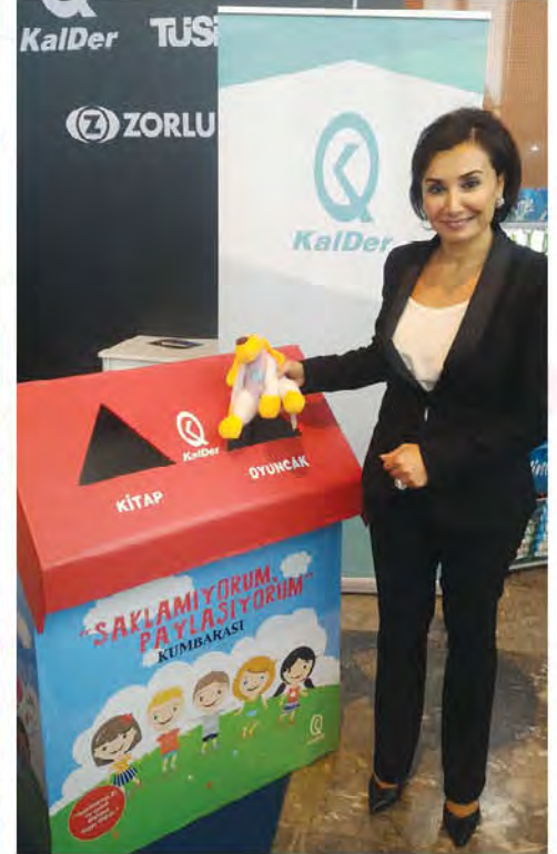
Çocuklar ve oyuncaklarla ilgili hassasiyeti bilinen Sanatçı Sunay Akın, beraberinde getirdiği oyuncak ile kumbaramıza destek de oldu. Akın, 'Saklamıyorum Paylaşıyorum' kampanyasına gönülden destek verdiğini söyledi.